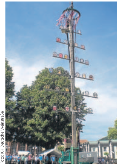
Der Zunftbaum der KH Deutsche Weinstraße in Neustadt