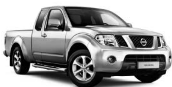
NAVARA KING CAB 4x4 XE