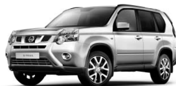
X-TRAIL 4x4 XE 2,0 l dCi, 110 kW (150 PS)